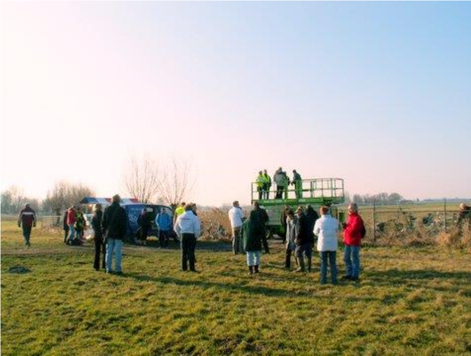
Nog één keer de Woudwegdag